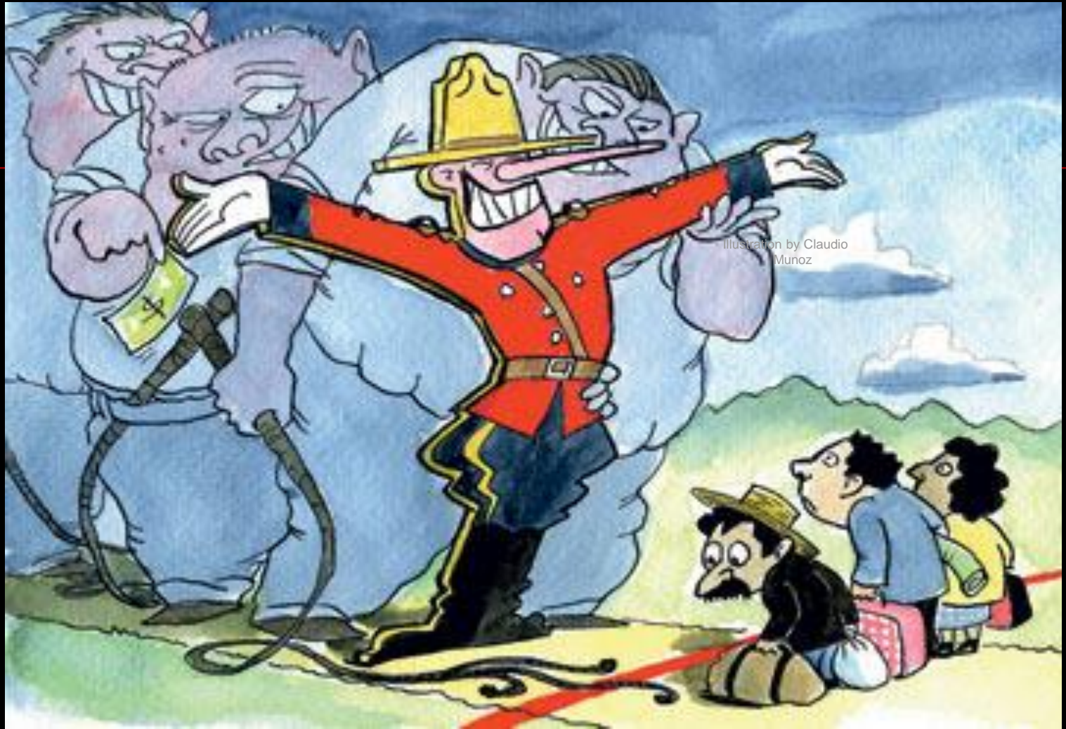
Illustration by Claudio Munoz